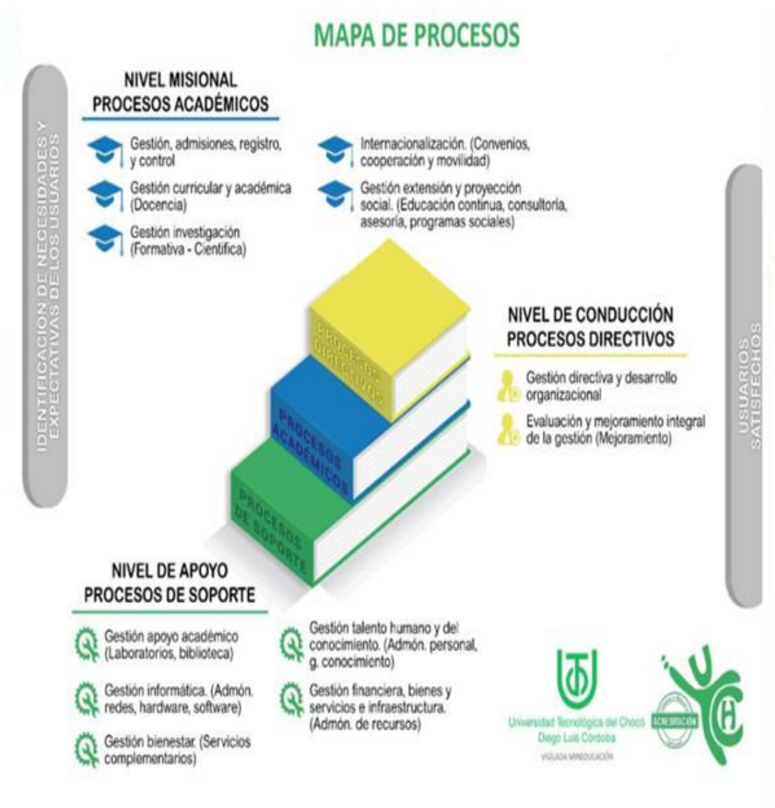
Figura 1. Mapa de procesos

Gestión Informática-GINF Gestión Bienestar-GB Gestión talento humano y del conocimiento-GTH El macroproceso Financiera integrado por: Gestión Financiera-GFIN Gestión Bienes, servicios e infraestructura-GBS