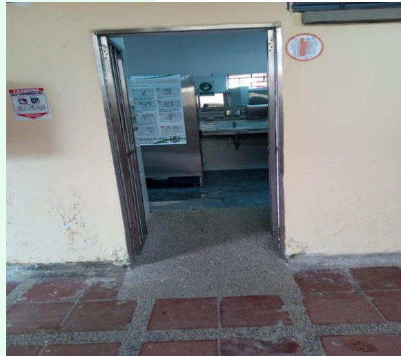
Foto: Bateria Sanitaria PMR

En la carrera séptima se cuenta con el consultorio jurídico, dicho consultorio se desarrolló en un solo nivel (primer piso) y cuenta con las rampas de acceso requeridas y las baterías sanitarias adecuadas para el personal con movilidad reducida.