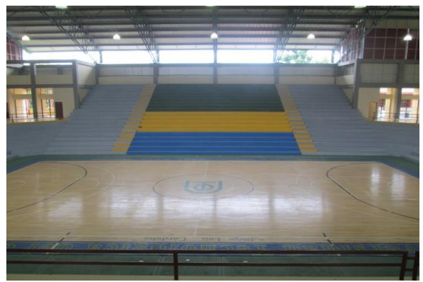
Coliseo Cubiero : Bloque No. 7