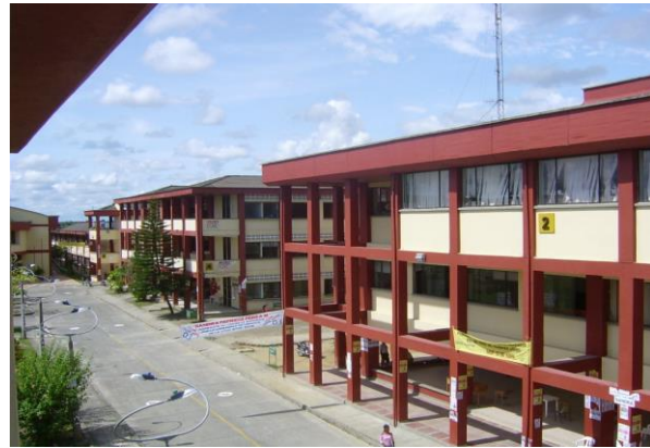
Bloque 2: Cultural.