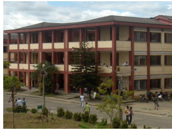
Bloque 4: Aulas