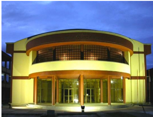
Bloque 7: Auditorio

Ciudadela Universitaria, Barrio Nicolás Medrano Conmutador, (4)6710237, Secr. Gral. 6710274, Fax 6710172 email: utch2@telecom.com.co / www.utch.edu.co