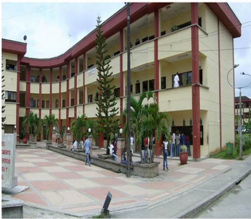
Bloque 1: Administrativo