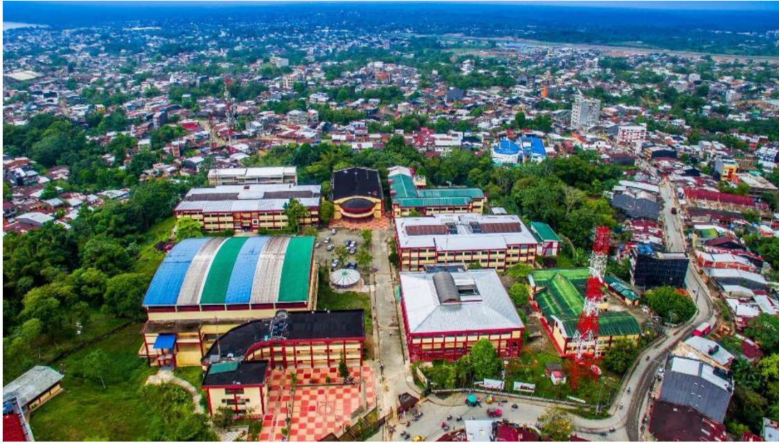
Vista Aerea Ciudadela Universitaria

Ciudadela Universitaria, Barrio Nicolás Medrano Conmutador, (4)6710237, Secr. Gral. 6710274, Fax 6710172 email: utch2@telecom.com.co / www.utch.edu.co