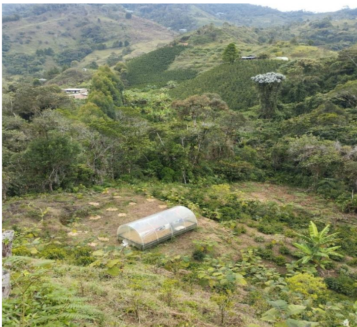
Foto 7, zona Rural de El Carmen de Atrato 7

La evaluación en el territorio por parte del DANE, Academia y otras entidades oficiales en 2005 y 2018, explicitan otros indicadores como el Índice de condiciones de vida y el índice de necesidades básicas insatisfechas en niveles alarmantes dados los resultados en la calidad vida de las Comunidades en los diferentes territorios del Chocó, el presente documento establece una aproximación académica desde la reflexividad interna y externa a dichos análisis en los múltiples condicionantes del “Desarrollo”.