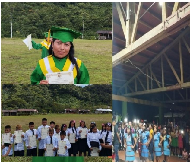
Foto 4, Estudiantes en graduación y jornada cultural; primaria y bachillerato 4

En consecuencia y adicional a lo anterior, es precisamente la idea de que, la acumulación de capital y el componente práctico del crecimiento económico, no es sinónimo de justicia social y prosperidad económica dado que, concentra, privatiza y limita el desarrollo de habilidades en escasos y determinados lugares, actores o poderes de la sociedad.