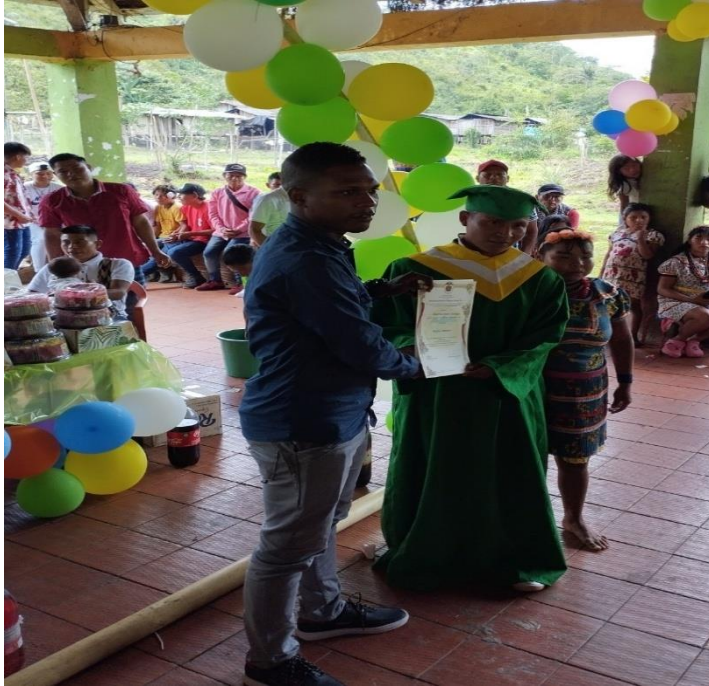
Foto 8, Estudiante Embera recibe su Diploma del Bachillerato 8