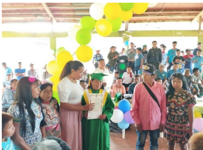
Foto 1, graduación de Estudiantes Embera 1