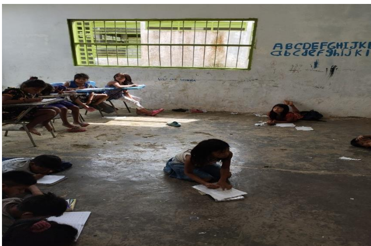
Foto 2, estudiantes en aula de clase 2

En el texto desarrollado se observará que la crisis humanitaria en el Departamento del Chocó en relación a la existencia de condiciones de vida indignas en muchas comunidades, se reflejan desde la estadística en el ineficaz modelo económico de la región, en la desigual inversión desde el Estado al territorio y en la inexistente mejora en la calidad de vida de las Personas. La estructuración económica y estatal no aporta de manera significativa a las comunidades del territorio; bienestar, justicia social y adicionalmente; ejerce una presión indebida sobre el equilibrio ambiental y natural de sus ecosistemas.