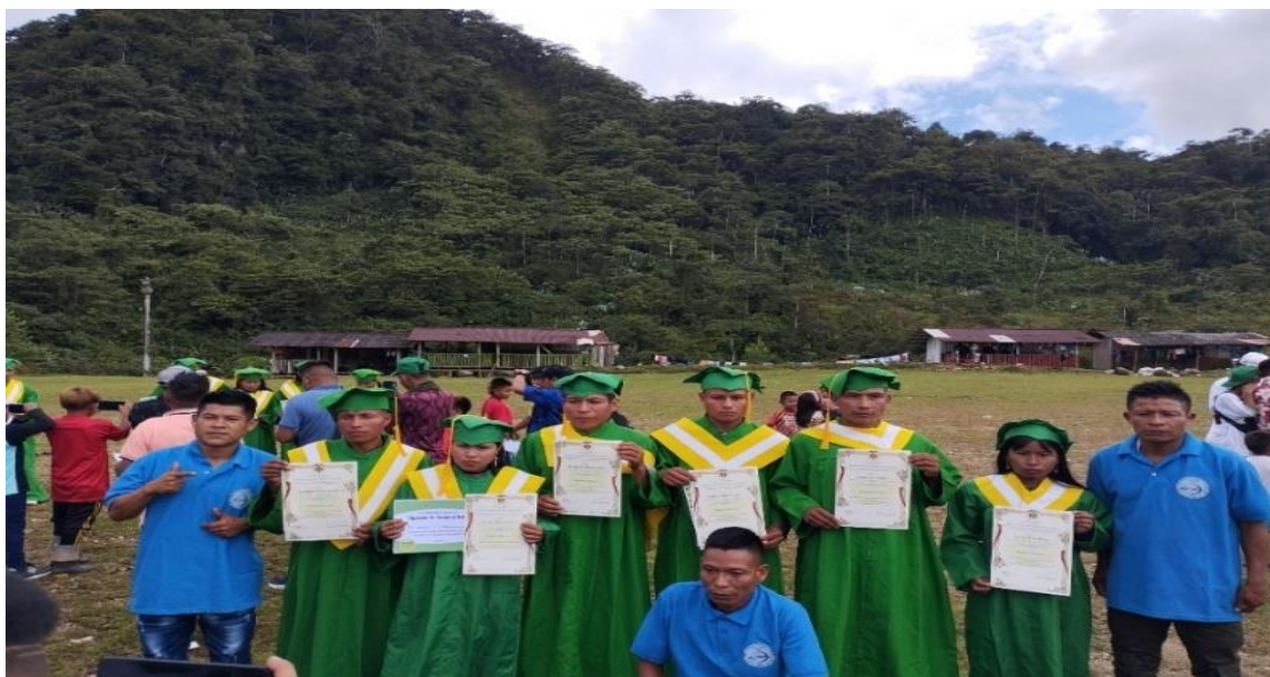
Foto 3, Graduación Embera 3