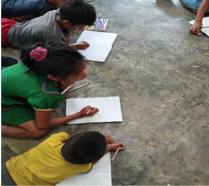
Foto 6, estudiantes Embera 6

En la siguiente tabla se muestra el aporte del PIB del Chocó al PIB Nacional en los años descritos.