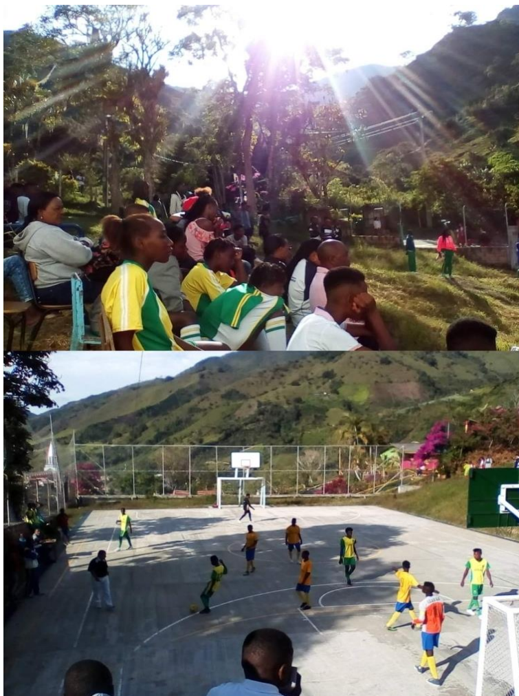
Foto 5, Estudiantes del Chocó en intercolegiados 5

Al resto de Colombia el aporte invaluable e histórico en términos de medición al conglomerado nacional también es fructífero en industrias diversas, artes, educación formal, educación ambiental, disposición hídrica, música, servicios y desarrollos tecnológicos de robótica e inteligencia artificial.